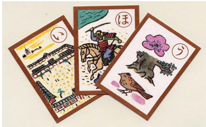
『武蔵府中 郷土かるた』