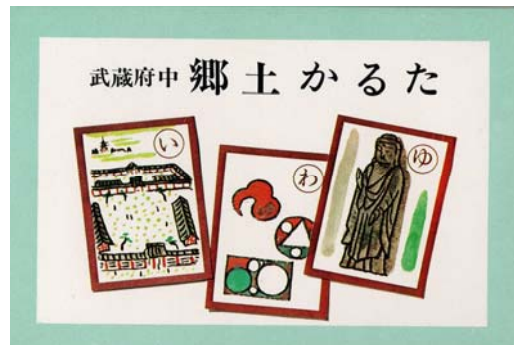
『武蔵府中 郷土かるた』