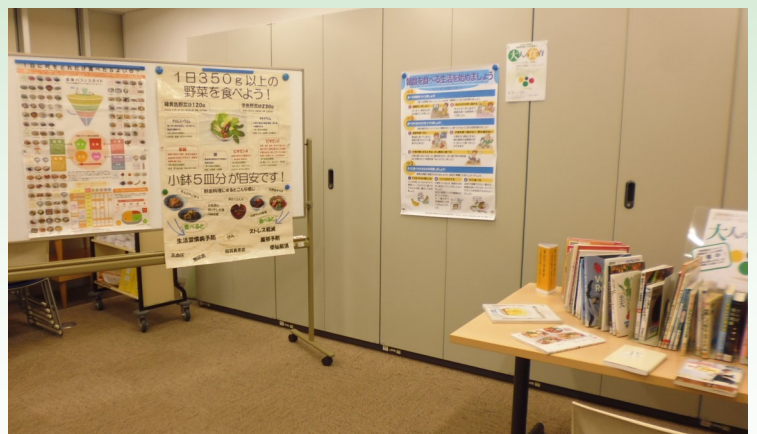
ボランティア活動室の展示の様子