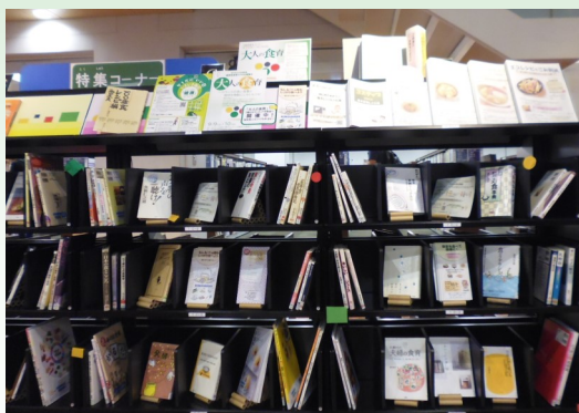
特集本コーナーの展示の様子