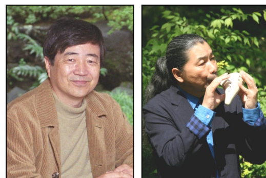
北村薫 : 直木賞作家。代表作は『ス キップ』『ニッポン硬貨の謎』 (本格ミステリ大賞評論・研究 部門受賞)、『鷲と雪』(直木三 十五賞受賞)など。 宗次郎 : オカリナ奏者。代表作は1986 年のNHK特集「大黄河」の音 楽、東京ガス環境エネルギー 館のテーマ映像「地球の一日」 BGMなど。