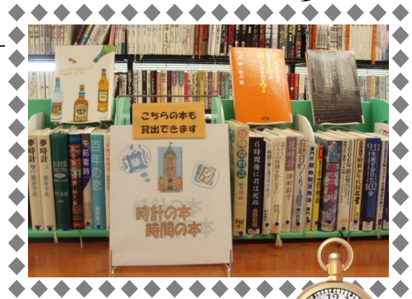
写真は6月の展示の一部 「時計の本/時間の本」「おとうさん」「雨・かさ」ほかにも準備中

西府図書館は昭和47年に開設されました。話題の本はもちろん、図書館でしか手に取ることのできない懐かしい蔵書が特に豊富なのも魅力です。展示コーナーも常時、数種類おこなっています。3月には南武線西府駅が開通、徒歩2分と交通も便利になりましたが、まだまだ緑が豊かな地域です。自然散策の後は、ゆったりと読書はいかがですか。お気に入りの1冊に巡りあえるかもしれません。ぜひお立ち寄りください。