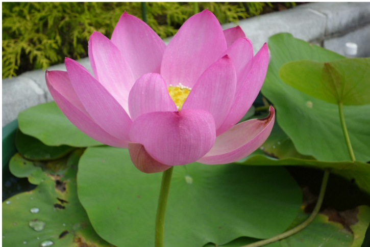
写真は、昨年6月30日に開花した中央図書館の大賀ハスの花です。